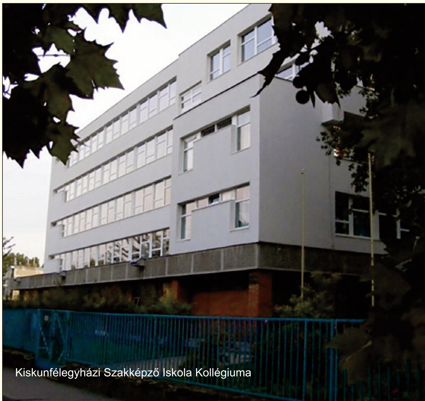
Kiskunfélegyházi Szakképző Iskola Kollégiuma