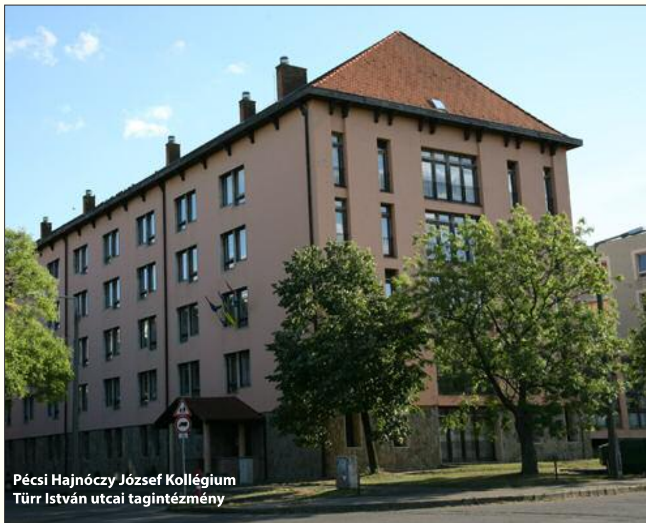
Pécsi Hajnóczy József Kollégium Türr István utcai tagintézmény

- avagy a kollégiumi szakma szerepvállalása a pedagógusképzés megújítására létrehozott projektben